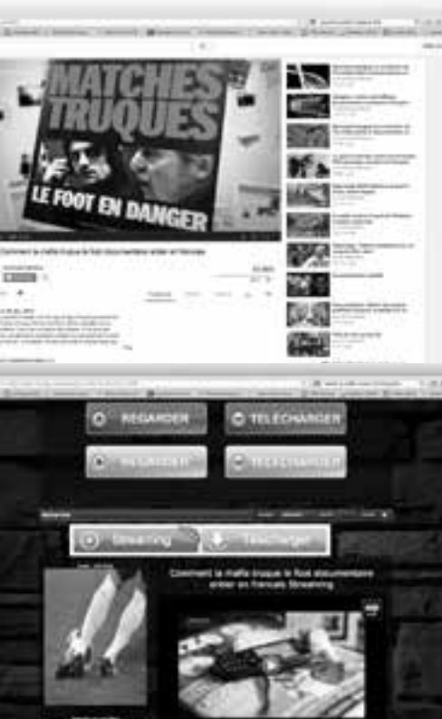
Comment la mafia truque le foot, de Patrick Oberli et Fulvio Bernasconi, a été visionné plus de 115 000 fois via des canaux pirates